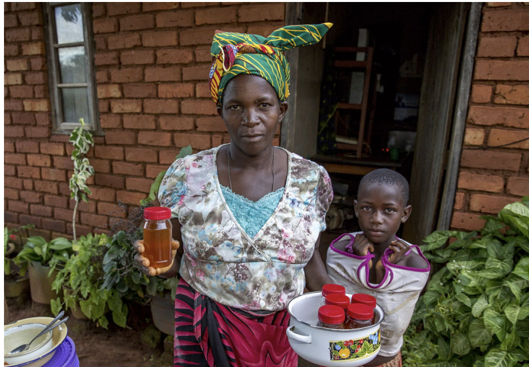
Familie i Malawi viser fram matvarer.