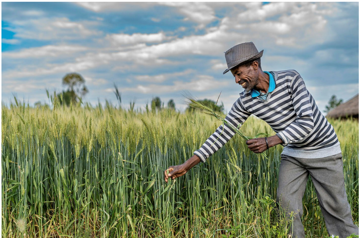
En bonde i åkeren sin i Etiopia.

For å redusere sult og underernæring er vi nødt til å investere i småskala landbruk. Verdensbanken er blant de mange aktørene som peker på landbruket som den mest effektive måten å bekjempe sult og fattigdom på. Ifølge Verdensbanken er vekst i landbrukssektoren mer enn dobbelt så effektivt for å redusere fattigdom som vekst i andre sektorer (Verdensbanken, 2015, s. 7). Dette gjelder ikke bare for å skape utvikling over tid, men også i krisesituasjoner: FAO viser til at det er vesentlig mer kostnadseffektivt og virkningsfullt å støtte bønder matproduksjon i stedet for å dele ut mat (FAO, 2023).