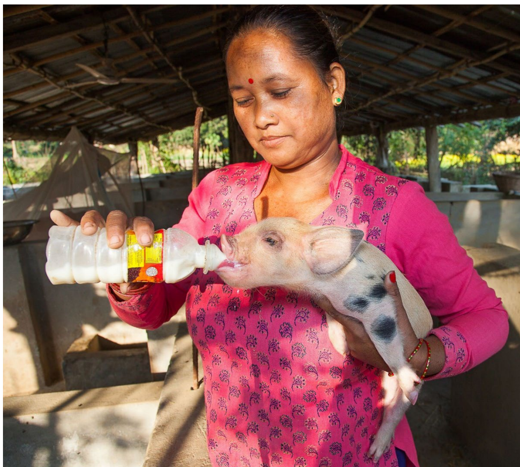
Fôring av grisunge i Nepal.

Bønder må ikke bare kunne dyrke klimarobuste plantesorter. De må også være i stand til å få transportert og selge avlingene sine til en anstendig pris. Myndigheter må kombinere investeringer i jordbruk med sosiale beskyttelsesprogrammer, for å sikre at folk har inntekt og tilgang til mat også i vanskelige tider. Og relevante departementer må samarbeide tettere: landbruk og miljø, helse og utdanning, økonomi og utviklingssamarbeid.