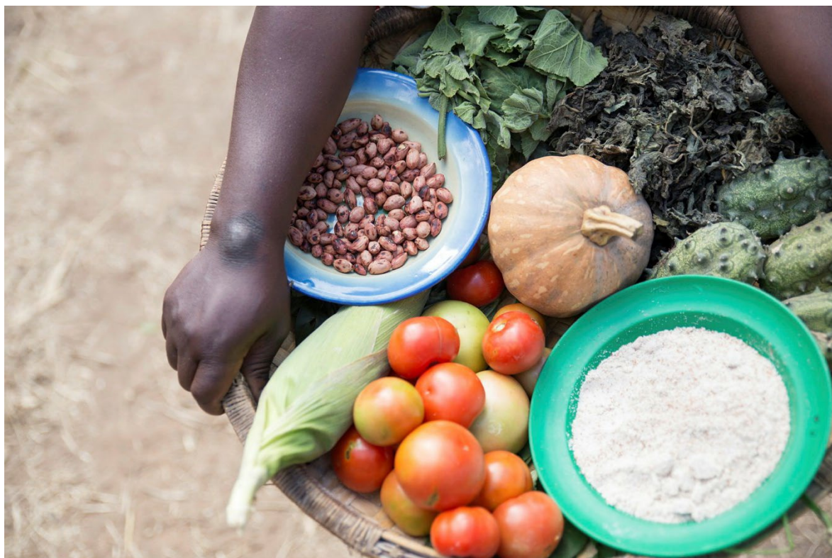
En bonde viser fram ulike matplanter i Malawi.