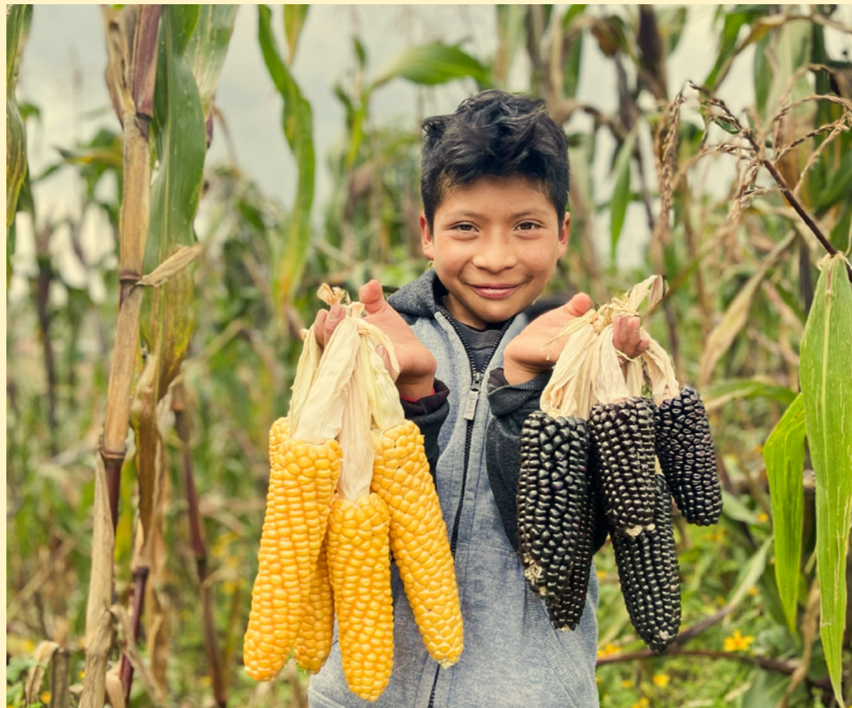
Darwinprogrammet i Guatemala, Honduras, Nicaragua og Costa Rica skal styrke det biologiske mangfoldet, ved å blant annet ivareta og utvikle ulike typer mais.

I 2023 styrket Utviklingsfondet arbeidet med klimatilpasning og matsikkerhet i Guatemala og Mellom-Amerika gjennom et nytt program støttet av The Darwin Initiative. Darwinprogrammet er en britisk statlig tilskuddsordning som bidrar til bevaring av biologisk mangfold og forbedring av levekårene til lokalbefolkningen.