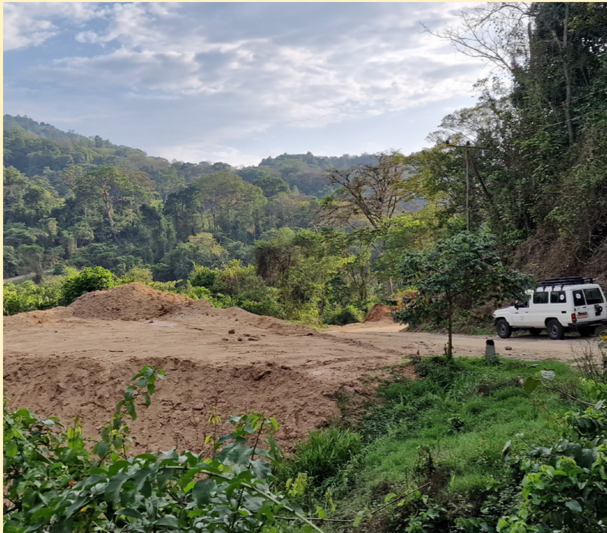
Utviklingsfondet arrangerte en reise med flere representanter fra kaffebransjen til Etiopia. De fikk innblikk i EUs bærekraftsdirektiv for å forhindre avskoging, og besøkte UNESCO-beskyttet villkaffeskog.

I året som gikk har Markeds- og kommunikasjonsavdelingen blant annet arbeidet med å rekruttere flere utviklingsinvestorer og faste givere, jobbet nært med norsk kaffebransje for å rette fokus på en mer bærekraftig verdikjede, drevet en politisk påvirkningskampanje, og hatt bondebesøk fra Guatemala.