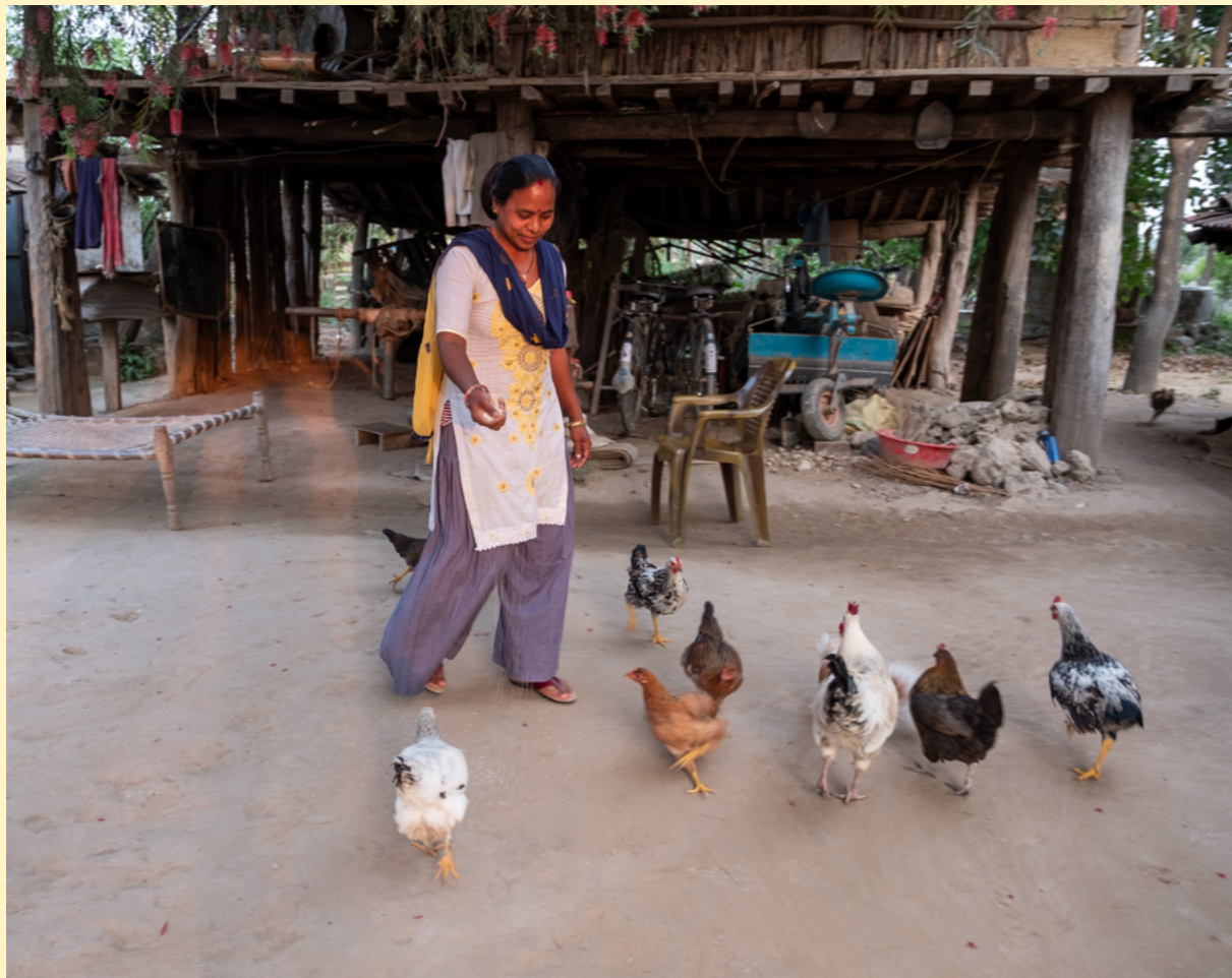
Programdeltakere i Nepal forteller at de gjennom programmet har introdusert flere forskjellige typer grønnsaker i kostholdet sitt, og egg fra egne høner.

Årets suksess er ikke en enkelthistorie. Det er mange historier fra flere land, båret fram av folk på grasrota, folk med små åkerlapper og ingen penger i banken, som bekrefter at metoden Utviklingsfondet sverger til bidrar til endring.